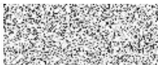
Ing. Vlastimil Pícek Starosta města Brandýs nad Labem-Stará Boleslav